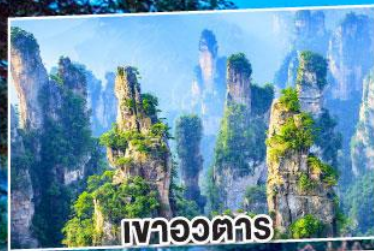
เขาอวตาร