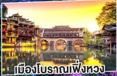
เมืองโบราณเฟิ่งหวง