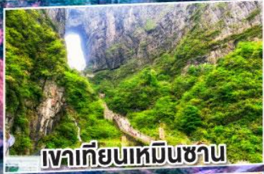
เขาเทียนเหมินซาน