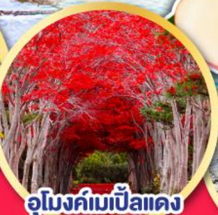
อุโมงค์เมเปิ้ลแดง ณ สวนลับฮิราโอกะ