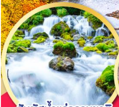
สัมผัสน้ำแร่ธรรมชาติ ณ สวนฟุทิดาชิ