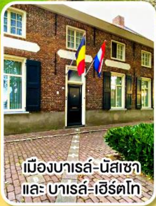
เมืองบารส์-นัสซา และ บารส์-เฮิร์ตโก