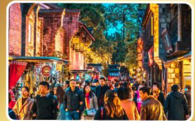
ถนนโบราณชอยกวางชอยแคบ