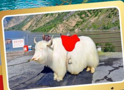
จามรีทะเลสาบเตี้ยซี