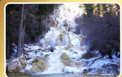
อุทยานไหวหนี่โกว