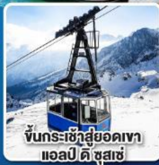
ขึ้นกระเช้าสู่ยอดเขา แอลป์ ดิ ซูสเซ่

เที่ยวเมืองอินส์บรุค เพชรเม็ดงามสุดโรแมนติก แห่งแคว้นทิโรล