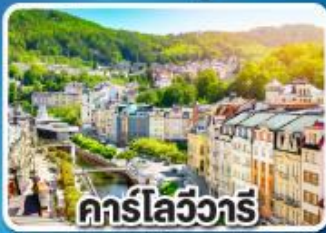
คาร์ลสบาด