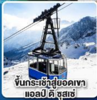
ขึ้นกระเช้าสู่ยอดเขา แอลป์ ดิ ซุสแซ่

เที่ยวเมืองอินส์บรุค เพชรเม็ดงามสุดโรแมนติก แห่งแคว้นทิโรล