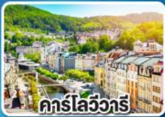
คาร์ลสบาด