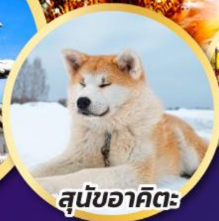
สุนัขอาคิตะ