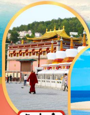
วัดท่าอ้อ