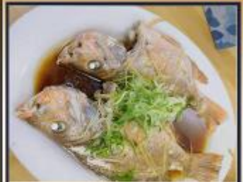
ปลาหนึ่งซีอิ้ว