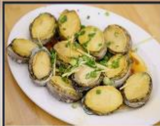
เป่าฮื้อสดนึ่ง