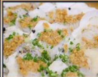
หอยเชลล์อบวุ้นเส้น