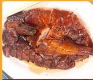
ท่านอย่าง