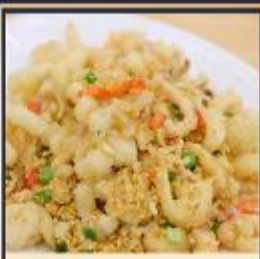
หมึกทอดกระเทียม