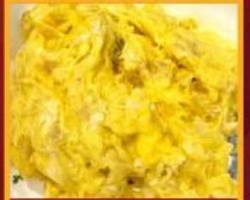
ไข่เจียวทรงเครื่อง