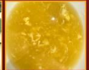
ซุ๊ปข้าวโพด