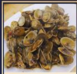
ผัดหอยลาย