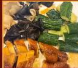
ไก่ แดงกวาง เห็ดหูหนู