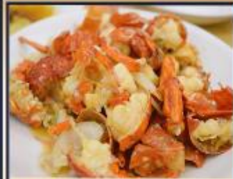
กุ้งมังกรอบซีส