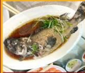
ปลาหนึ่งซีอิ้ว