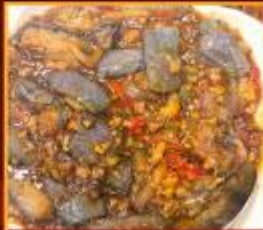
มะเขืออบหม้อดิน