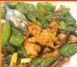
หมูผัดพริกหยวก