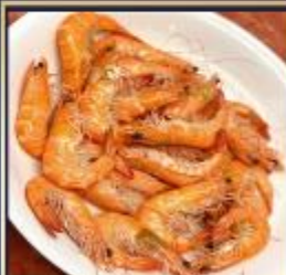
กุ้งหวานลวก