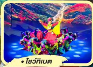
• โชว์ทิวศ