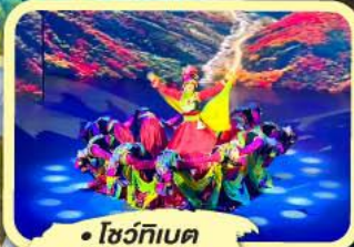
• โชว์ทิวเบต