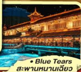
• Blue Tears สะพานหนานเฉียว