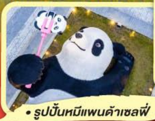
• รูปปั้นหมีแพนด้าเซลฟี่