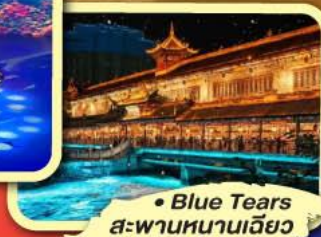
• Blue Tears สะพานหนานเฉียว