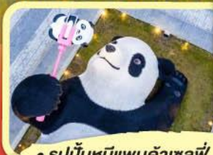
• รูปปั้นหมีแพนด้าเซลฟี่