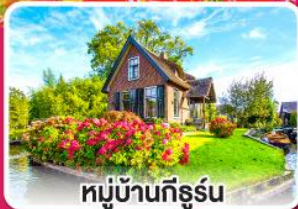
หมู่บ้านที่รัฐน