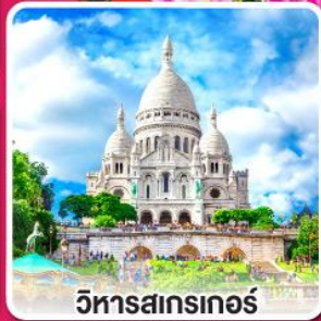
วิหารสกรเกอร์

อร่อยกับเมนู หอยแมงกุ่มบไวน์ขาว หอยเอสคาโก, ทาหมูเยอรมัน