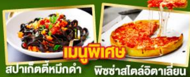
เมนูพิเศษ สปากัดดีหมักดำ พิซซ่าสไตล์อิตาลี