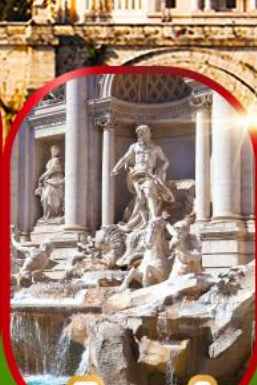
น้ำพุทรี