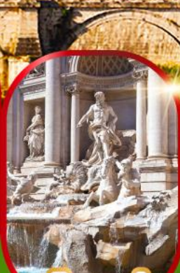
น้ำพุเทรวี่

เดินทาง 15-22 พ.ย.67 28 พ.ย. - 5 ธ.ค.67 26 ธ.ค.67 - 2 ม.ค.68(ปีใหม่) 28 ธ.ค.67 - 4 ม.ค.68(ปีใหม่)