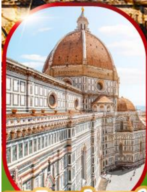
มหาวิหารฟลอเรนซ์