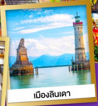
เมืองลินเดา