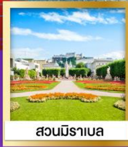
สวนมิราเบล