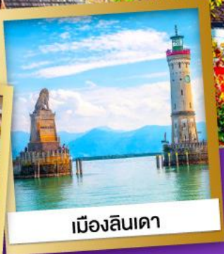
เมืองลินเดา