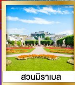
สวนมิราเบล