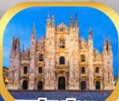
มหาวิหารมิลาน