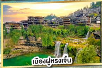
เมืองฝูหลงเจิน