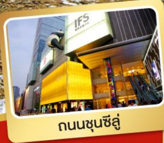
ถนนชุนชี่ลู่