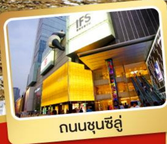
ถนนชุนชี่ลู่