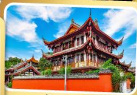
วัดหวินซู