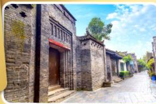
ถนนโบราณชอยกวางชอยแคบ