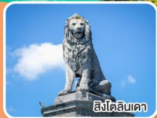
สิงโตลิบเดา