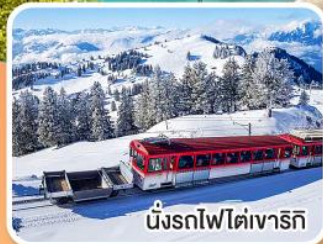
นั่งรถไฟไต่เขารัก