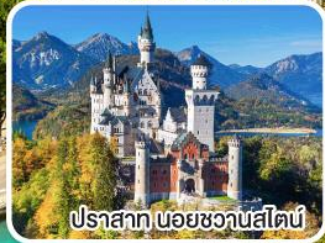
ปราสาท นอยชวานสไตน์