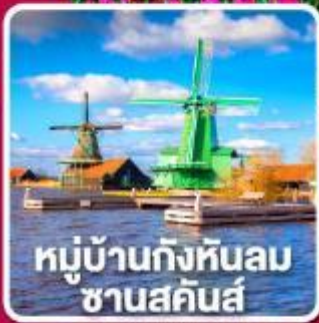
หมู่บ้านกังหันลม ชาวนสคันส์