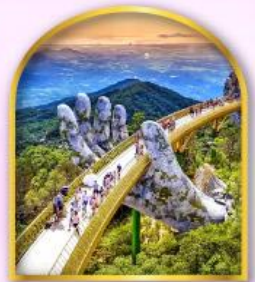
สะพานมือยักษ์