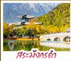
สระมั่งกรถ้ำ