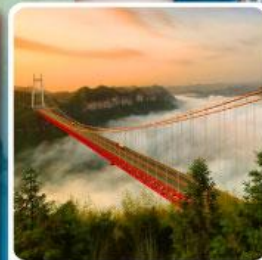
สะพานแขวนอ๋ายจ้าย