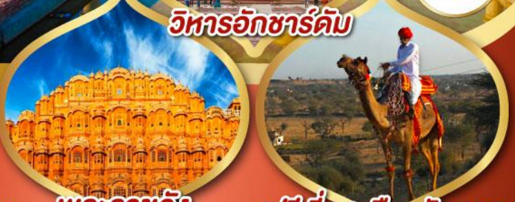
วิหารอักซาร์ดัม