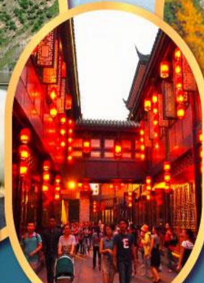
ถนนโบราณจิ้นหลี่