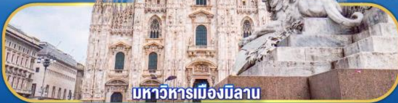
มหาวิหารเมืองมิลาน