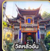
วัดหลิวอัน