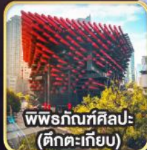
พิพิธภัณฑศิลป์- (ตึกตะเกียบ)