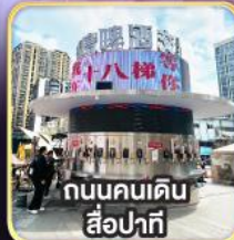
ถนนคนเดิน สือปาที