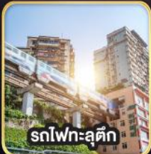
สทไฟทะลุดึก