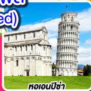
หอนอนปิซ่า