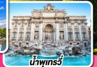
น้ำพุเทรวี่

09-18 พ.ค. 68 16-25 พ.ค. 68 30 พ.ค.-08 มิ.ย. 68 13-22 มิ.ย. 68