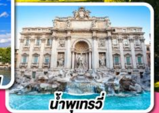
น้ำพุกรวี