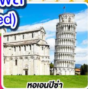
หออนปิซ่า