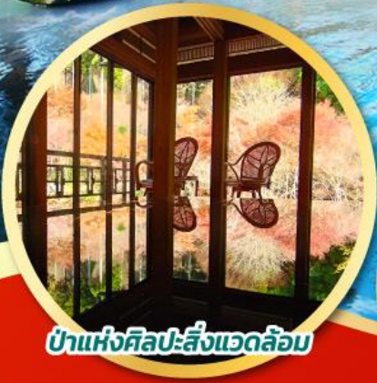
ป่าแห่งศิลปะสิ่งแวดล้อม