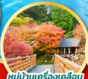
หมู่บ้านเครื่องเคลือบ โอคาวาจิยามะ