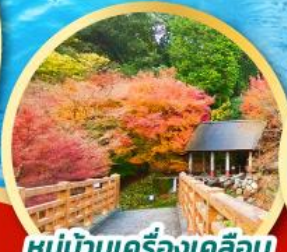
หมู่บ้านเครื่องเคลือบ โอคาวาจิยามะ