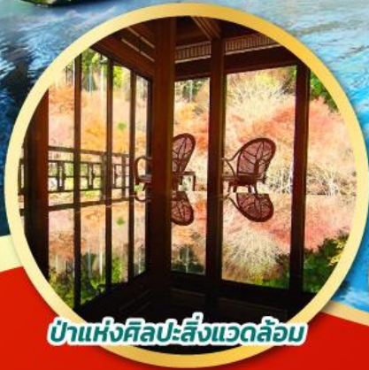
ป่าแห่งศิลปะสิ่งแวดล้อม