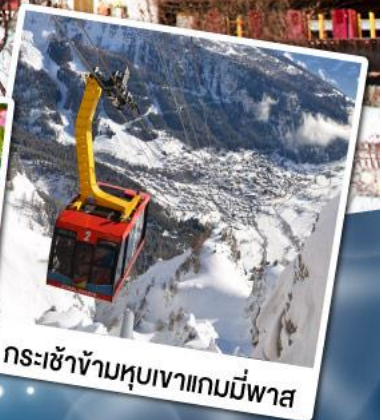
กระเช้าข้ามหุบเขาแกมมีพาส