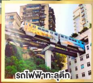
รถไฟฟ้าทะลุตึก