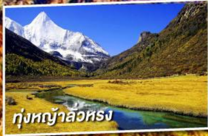
ทุ่งหญ้าลั่วหรง

เที่ยว 2 ภูเขาหิมะศักดิ์สิทธิ์ไปห่ม่า และ ภูเขาหิมะเหมยลี่ ชมใบไม้เปลี่ยนสี ณ อุทยานย่าตง ( ไม่ลงร้านช้อปปิ้ง + ไม่จ่ายออฟชั่น )