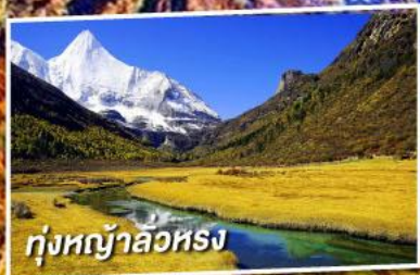
ทุ่งหญ้าลือหรง