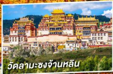
วัดลามะซงจ้านหลิน