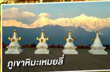
ภูเขาหิมะเหมยลี่