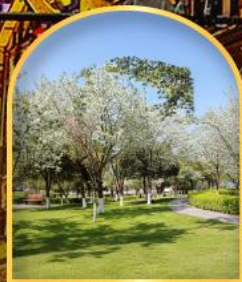
ชมดอกซากุระ ณ สวนจงหยาง