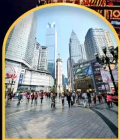
ถนนคนเดินเจียฟ้างเป่ย์