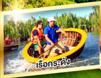
เรือกระดิง