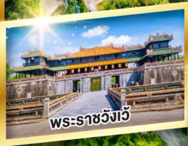
พระราชวังเว้