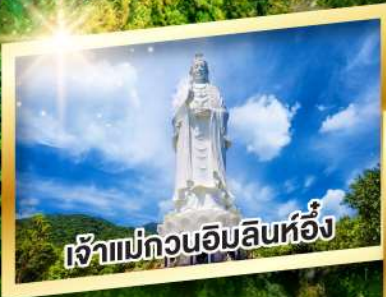
เจ้าแม่กวนอิมสินห์อึ้ง