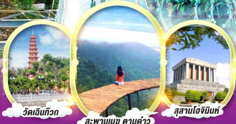
วัดเงินท้าว