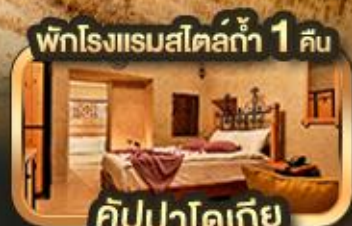
พักโรงแรมสไตล์ 1 คืน คัปปาโดเกีย