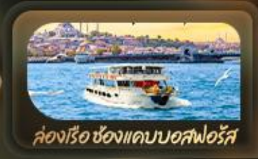
ล่องเรือ ช่องแคบบอสฟอรัส