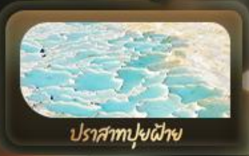
ปราสาทฟูฟ้าย