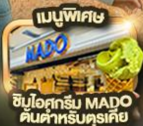
เมนูพิเศษ ช้อปปิ้งที่ MADO สินค้าสำหรับตุรกี