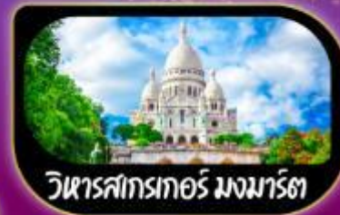
วิหารสกรทอร์ มงมาร์ต