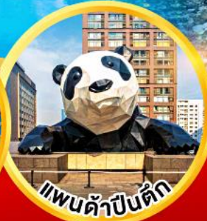
แพนด้าปิ่นตึก