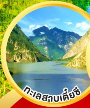
ทะเลสาบเต๋ยซี