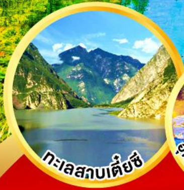
ทะเลสาบเต๋ยซี