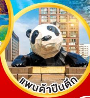
แพนด้าป็นดัก