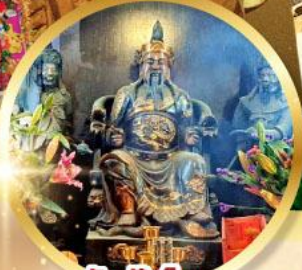
วัดปักไค

เสริมโชคลาภนำความรุ่งเรือง ทุกด้านของชีวิต