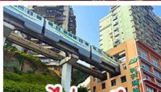
รถไฟทะลุคด