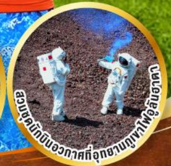
อวกาศที่อุกกาบาตพุ่งชน

เสียงเพรียกจากทุ่งหญ้า สู่ความลึกลับภูเขาไฟอุลันฮาตา