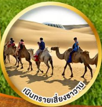
เป็นทรายเสียงชาวน