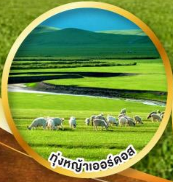
ทุ่งหญ้าเออร์ดอส