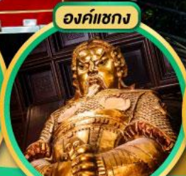
องค์แซกง

นมัสการองค์เจ้าแม่กวนอิม ที่มีอายุกว่า 600 ปี