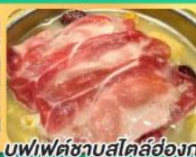
บุฟเฟ่ต์ชาบูสโตร์ฮ่องกง