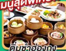
ติ่มซำฮ่องกง