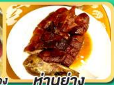
ห่านย่าง