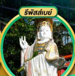
รัฟส์เบย์