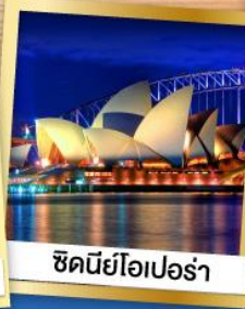
ซิดนีย์โอเปร่า