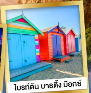
โบสถ์ดิน บาร์ตัง นีอกซ์