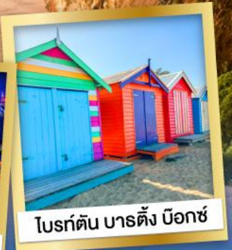
โบรด์วอล์ก บาร์ตัง บ็อกซ์