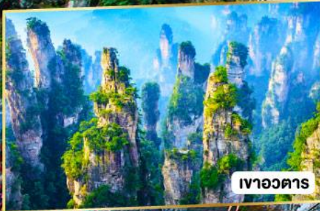
เวิวอวตาร