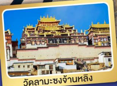
วัดลามะซงจ้านหลิง