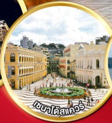
เวเนตัสแมกเก๊า