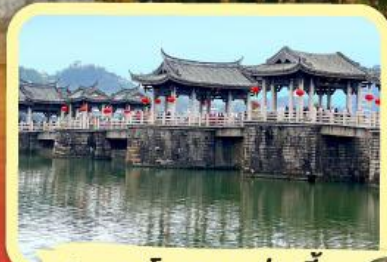
• สะพานโบราณกว้างจี