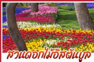
สวนดอกไม้อิสตันบูล