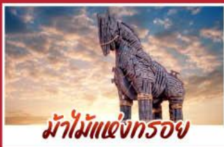
ม้าไม้แห่งทรอย