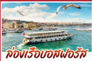
ล่องเรือบอสฟอรัส