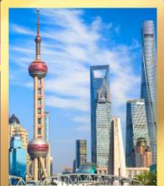
เซี่ยงไฮ้