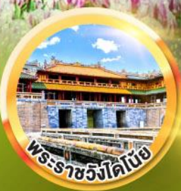
พระราชวังโคโบ๊