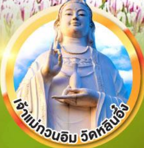
เจ้าแม่กวนอิม วัดหลินอึ้ง