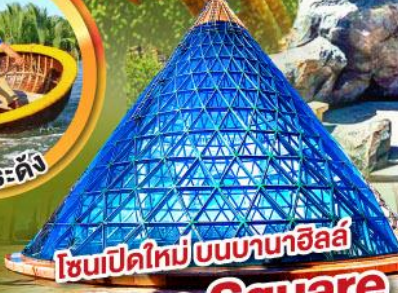
โซนเปิดใหม่บนบานาฮิลล์ Eclipse Square