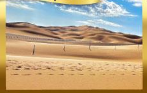
อุทยานโคโคโตไห่