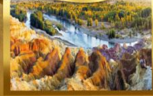
หาดห้าสี