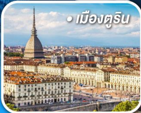
• เมืองตูริน