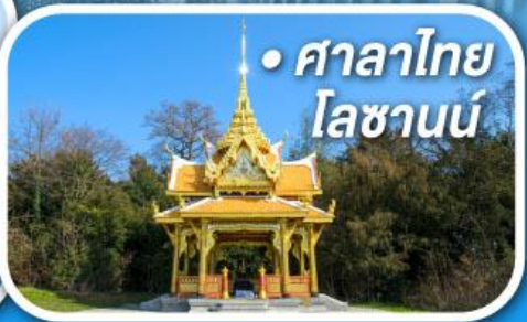
• ศาลาไทย โลซานน์

• สุดอากาศดีที่เซอร์แมท • ขึ้นกระเช้าสู่ยอดจากกลาเซียร์ 3000 • ชมเมืองคลาสสิกเบิร์น ลูเซิร์น ซูริก