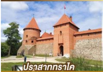
ปราสาทคราโต