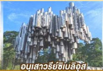
อนุสาวรีย์ซีเบลึส