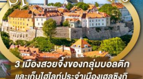
3 เมืองสวยจิ่งของกุ่มบอลติก และเก็บไฮไลท์ประจำเมืองเอสซิงกี และล่องเรือเฟอร์รี่ข้ามประเทศ

ไฮไลท์ในโปรแกรม • เที่ยวสามประเทศหลักกลุ่มบอลติก • ชมเมืองหลวงวิลนิอุส ประเทศลัตเวีย